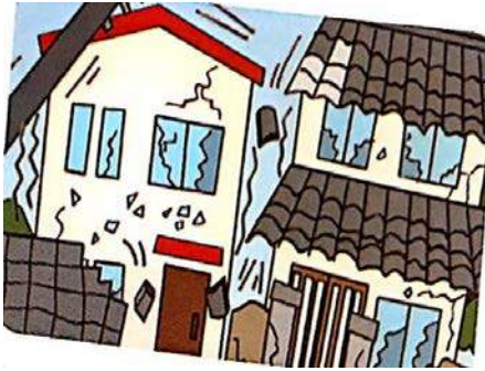
Un tremblement de terre

Un tremblement de terre a frappé ton ancien quartier. Les gens avaient trop peur. Les enfants couraient à gauche et à droite. Les murs des maisons et des immeubles se sont fissurés. les vitres des fenêtres se sont brisées. Les gendarmes et les policiers ont barré la rue pour laisser le passage à l'ambulance. Les pompiers sont enfin arrivés pour secourir les blessés.