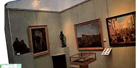
musée du Bardo -Alger-